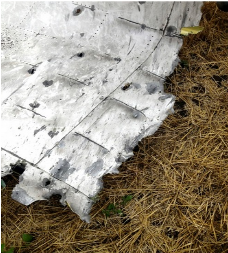
Noah Sneider and Sabrina Tavernise/The New York Times